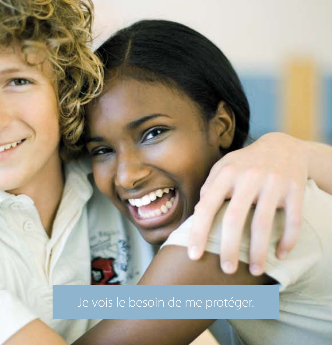
Je vois le besoin de me protéger.

gênant gratter inconfortable contagieux visible lésions laid fardeau excroissances mythes risques propager brûlements 100 sortes différentes cancer ITS pertes infection cellules général viral bosses maladie conséquences transmis vermes contact peau-à-peau